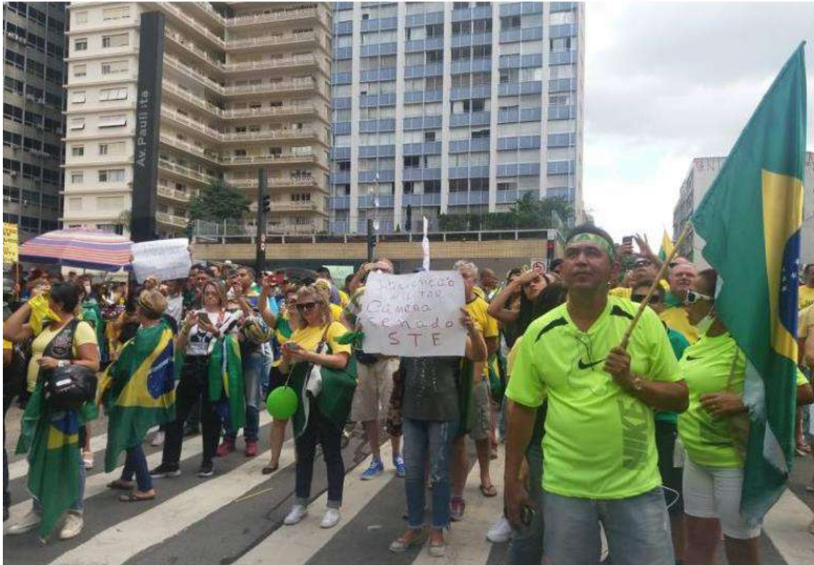
7- Faixa de protesto do dia 15 de março em São Paulo