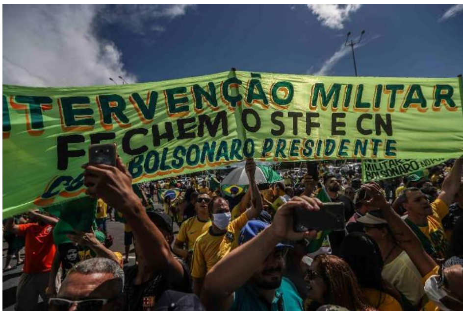
10 - Faixa em Brasília/DF pede intervenção militar nos protestos de 19 de abril.