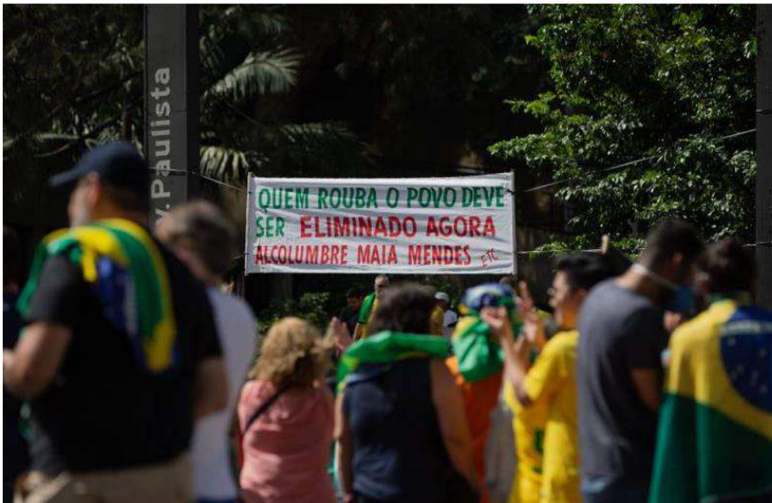
6 - Faixa de protesto do dia 15 de março em São Paulo

https://www.em.com.br/app/noticia/politica/2020/03/15/interna_politica.1129039/bolsonaro-participa-de-manifestacao-em-brasilia-e-atende-apoiadores.shtml .