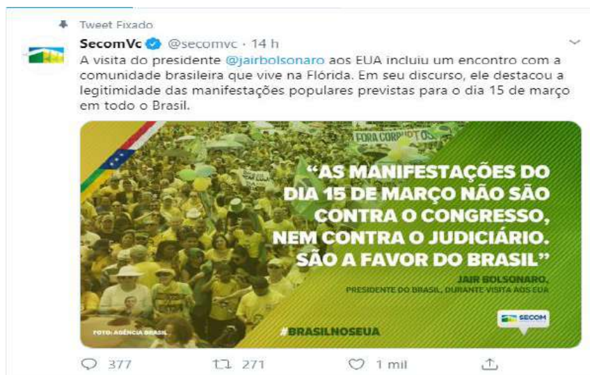
3 - Publicação da Secretaria de Comunicação da Presidência da República no Twitter

21. Embora mencionasse, numa atitude maliciosamente preventiva, não se tratar de movimento de oposição ao Congresso Nacional e ao Poder Judiciário, tal informação contrastava com o fato notório, àquela altura, de que as convocações da manifestação usavam palavras de ordem, hashtags e panfletos que atacavam diretamente as instituições democráticas, com pedidos como o de “ intervenção militar ”. Veja-se: