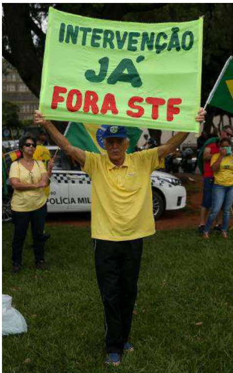
8 - Manifestante em Brasília/DF