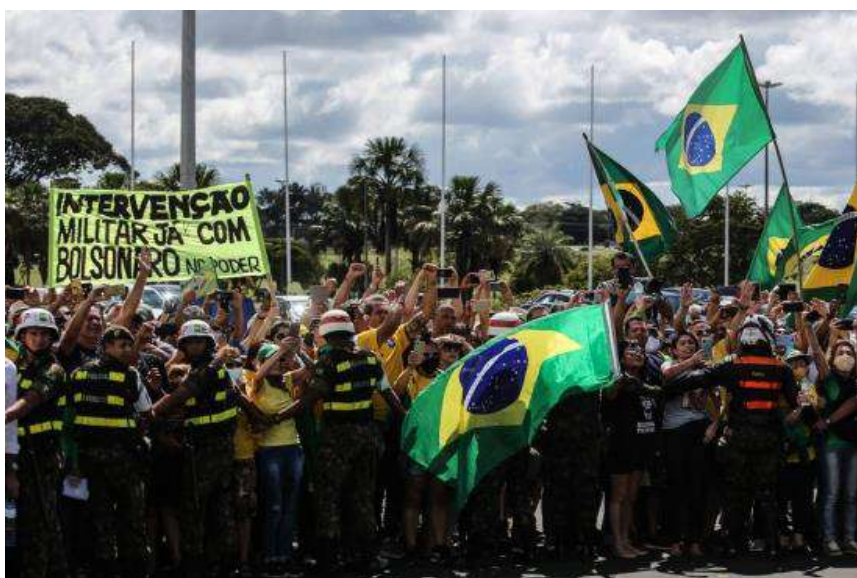
9 - Faixa em Brasília/DF pede intervenção militar nos protestos de 19 de abril

23. A desatinada conduta presidencial veio a repetir-se em 19 de abril de 2020, quando uma vez mais o Denunciado participou de ato público a favor de seu governo e em favor da quebra da institucionalidade democrática, em frente à sede do Quartel-General do Exército, no Setor Militar Urbano, em Brasília, onde, mesmo diante de faixas com nítido cunho autoritário, agradeceu a presença dos apoiadores e estimulou a sua conduta ao pronunciar que “Todos no Brasil têm que entender que estão submissos à vontade do povo brasileiro. Tenho certeza que todos nós juramos um dia dar a vida pela pátria. Vamos fazer o que for possível para mudar o destino do Brasil” 13 . Eis alguns registros fotográficos do evento, cuja localização agravou sobremaneira o tensionamento institucional, haja vista a inconveniente confusão provocada pelo fato de as atrevidas alusões à pretensão golpista terem sido hospedadas em área militar.