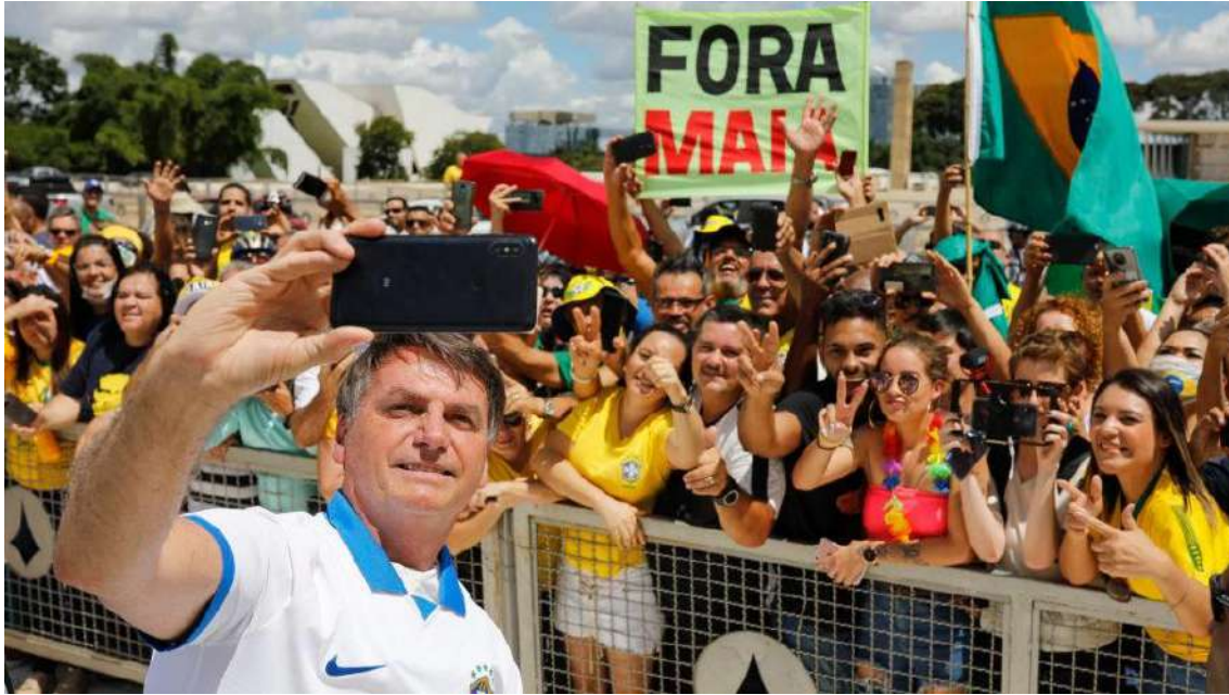
5 – Denunciado posa para fotos em manifestação datada de 15 de março de 2020.