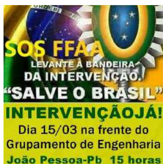
4 - Convocação para protestos ocorridos em João Pessoa/PB

21. Embora mencionasse, numa atitude maliciosamente preventiva, não se tratar de movimento de oposição ao Congresso Nacional e ao Poder Judiciário, tal informação contrastava com o fato notório, àquela altura, de que as convocações da manifestação usavam palavras de ordem, hashtags e panfletos que atacavam diretamente as instituições democráticas, com pedidos como o de “ intervenção militar ”. Veja-se: