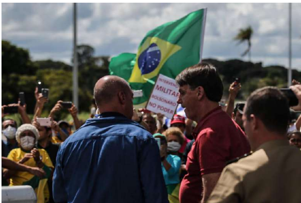
11 - Faixa em Brasília/DF pede intervenção militar nos protestos de 19 de abril, aos olhos do Presidente da República

24. O portal de notícias G1 noticiou à época o tom belicoso dos protestos realizados em 19 de abril de 2020, que contaram com a participação do Presidente da República 14 :