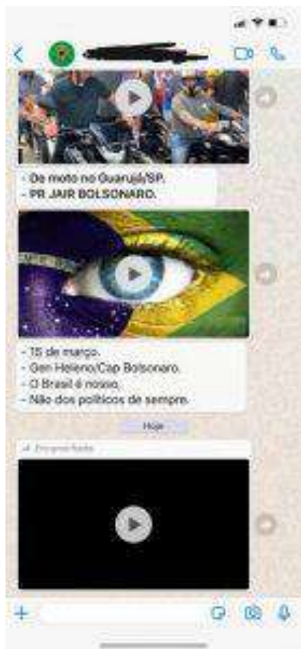
1 - Vídeo encaminhado pelo Presidente da República convocando para atos de 15 de março

do Poder Executivo Federal. As imagens a seguir reproduzidas expressam o teor do convite massivamente difundido para comparecimento a tais atos dedicados à subversão institucional.